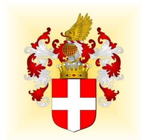
Blason de Thomas 1er

En mai 1196, Thomas I er épouse Béatrice-Marguerite de Genève, fille de Guillaume 1 er de Genève, comte de Genève et de Vaud, et de Béatrice de Valpergue. Ils auront quinze enfants.