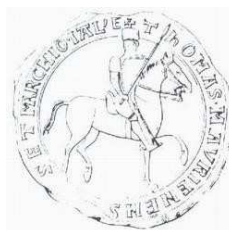
Sceau de Thomas 1er

Son soutien auprès de l'Empereur Frédéric II, lui permet d'obtenir, en 1226, le titre de vicaire impérial de Lombardie, devenant ainsi son représentant officiel.